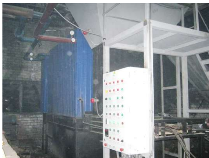
Рисунок 1.2.10 – Котел КВМ-1,16 в котельной бани