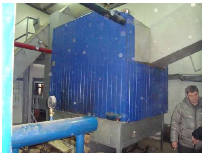
Рисунок 1.2.2 – Котел в котельной 23 квартала