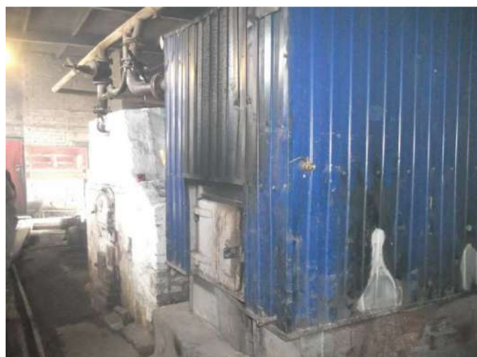
Рисунок 1.2.6 – Котлы котельной 27 квартала