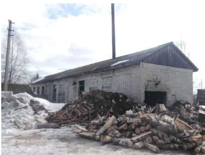
Рисунок 1.2.5 – Здание котельной 27 квартала