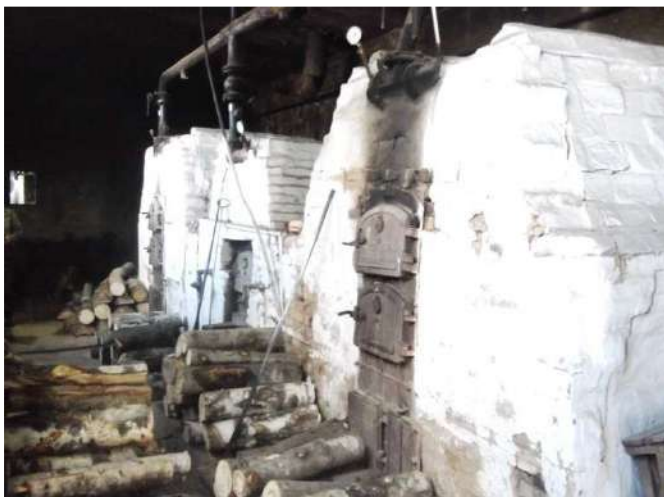
Рисунок 1.2.7 – Котлы в котельной Лесторга