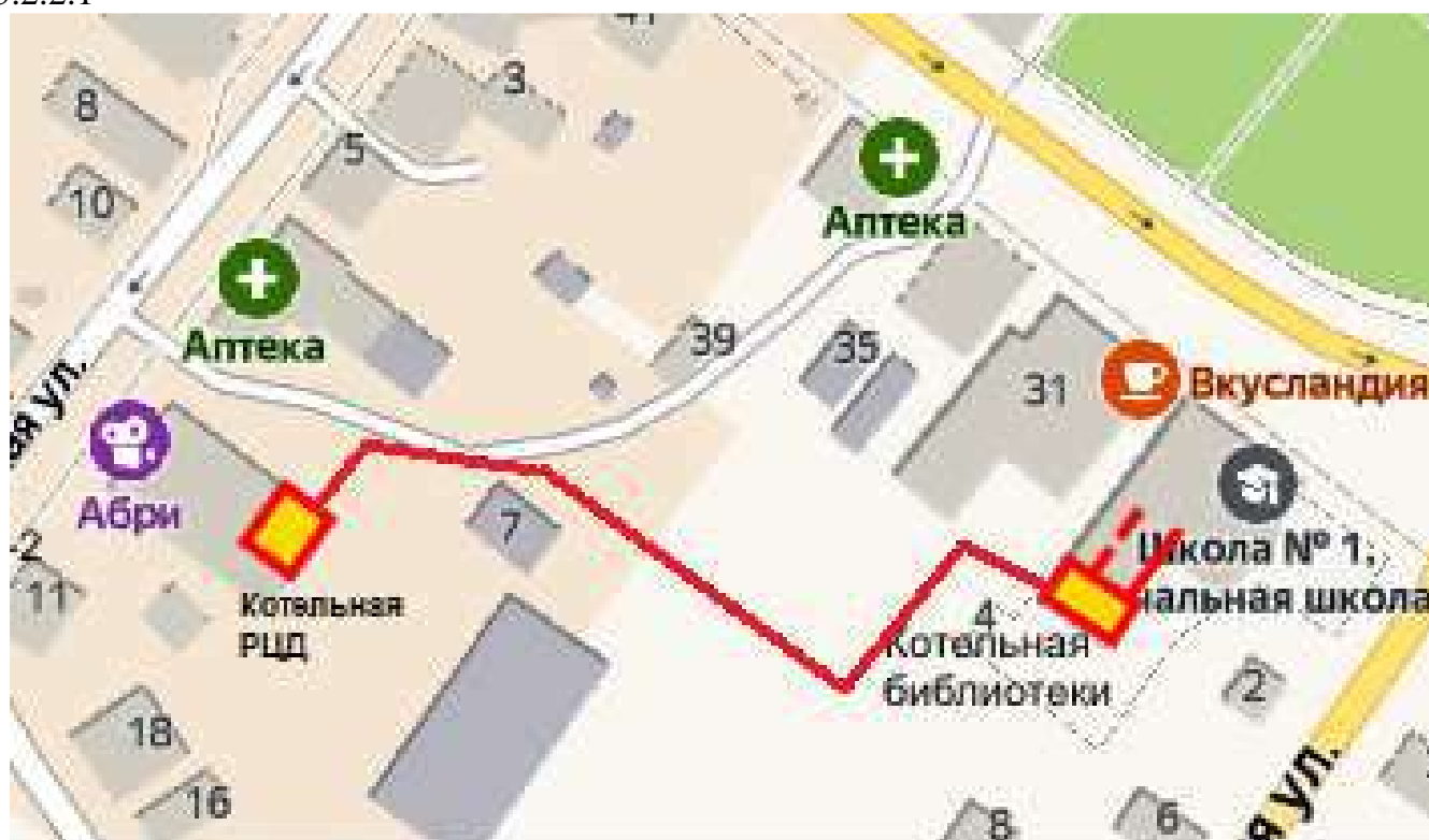
Рисунок 5.2.2.1 — Схема прокладки соединительного участка теплосети РЦД - библиотека В настоящее время установленная мощность котельной РЦД составляет 0,48 Гкал/ч, а подключенная тепловая нагрузка – 0,1 Гкал/ч. Имеющийся резерв тепловой мощности 0,38 Гкал/ч.

В качестве трубопроводов целесообразно использовать стальные предварительно изолированные трубы в ППУ-изоляции. Способ прокладки – бесканальный. Переход через проезжую часть выполнить в стальной гильзе. Схема тепловых сетей приведена на рисунке 5.2.2.1