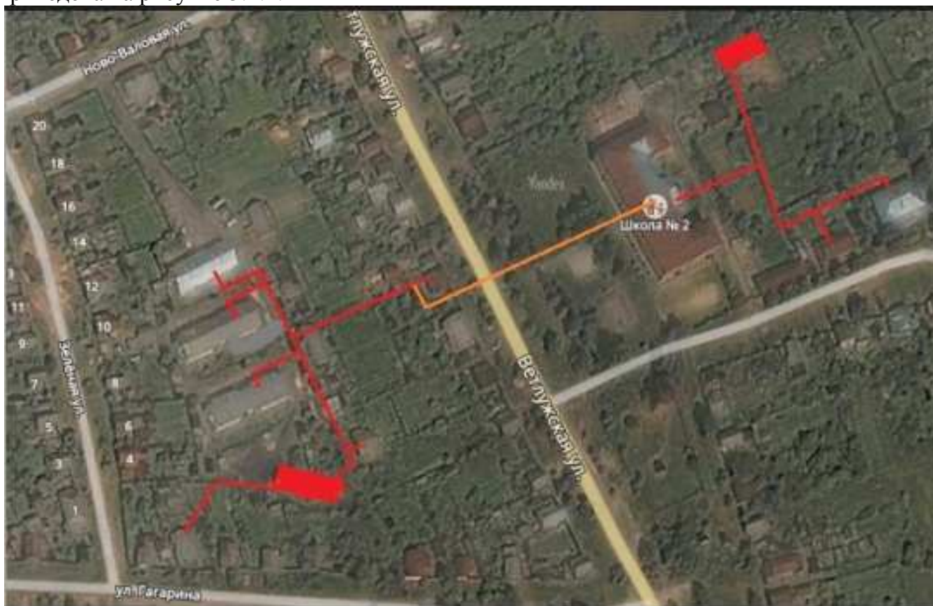
Рисунок 5.2.1 — Схема прокладки соединительного участка теплосети 27 квартал – школа №2

В качестве трубопроводов целесообразно использовать стальные предварительно изолированные трубы в ППУ- изоляции. Способ прокладки – бесканальный. Переход через проезжую часть улицы выполнить в стальной гильзе. Схема тепловых сетей 27 квартала приведена на рисунке 5.2.1.