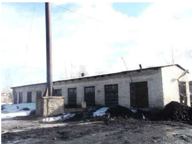
Рисунок 1.2.3 – Здание котельной 13 квартала