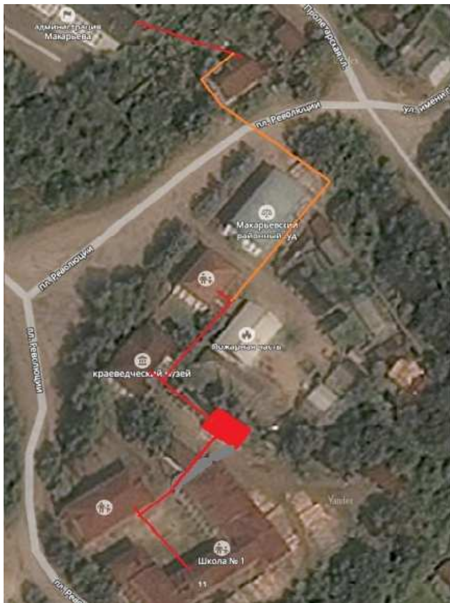
Рисунок 5.2.3.1 — Схема прокладки соединительного участка теплосети школа №1 – здание администрации района

В настоящее время установленная мощность котельной школы №1 составляет 1,06 Гкал/ч, а подключенная тепловая нагрузка – 0,4 Гкал/ч. Имеющийся резерв тепловой мощности 0,66 Гкал/ч. Однако старые котлы Универсал-6 и ТВН-1 нуждаются в замене. Является целесообразным на этой котельной установить новый щеповой котел КВТ-0,5.