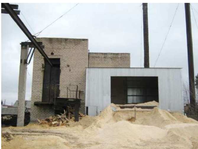
Рисунок 1.2.11 – Здание котельной 21 квартала