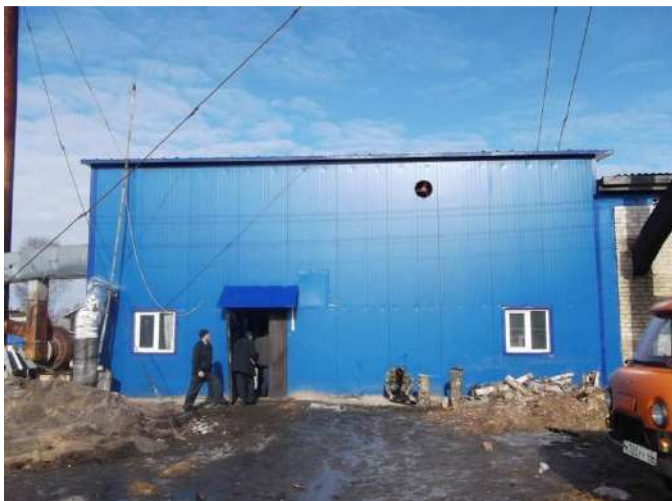
Рисунок 1.2.1 – Здание котельной 23 квартала