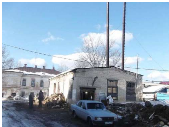
Рисунок 1.2.8 – Котельная школы №1