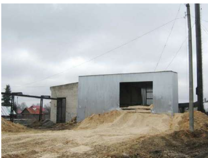
Рисунок 1.2.9 – Здание котельной бани