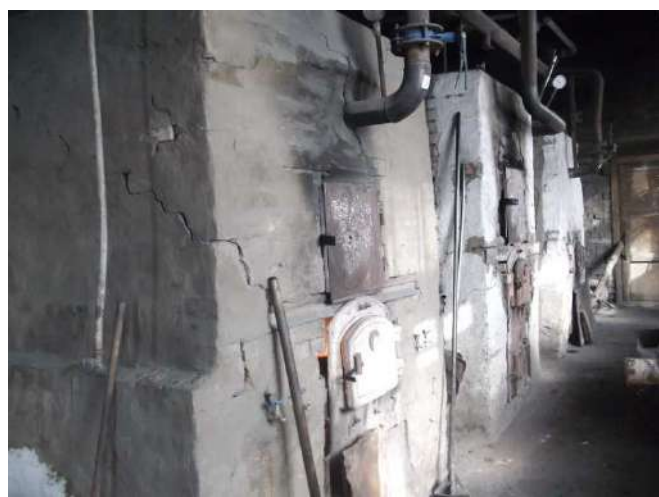
Рисунок 1.2.4 – Котлы котельной 13 квартала