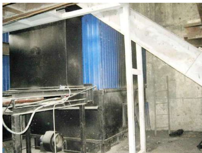
Рисунок 1.2.12 – Котел КВМ-2,0 в котельной 21 квартала